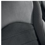
Комбинированная кожа 6 — QE+