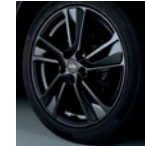
18" легкосплавный Tokyo Черный