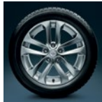
17" легкосплавный Sport