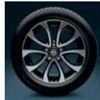
17" легкосплавный Shiro