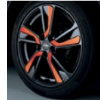
18" легкосплавный Tokyo Оранжевый