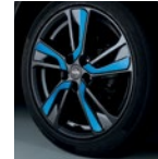
18" легкосплавный Tokyo Голубой